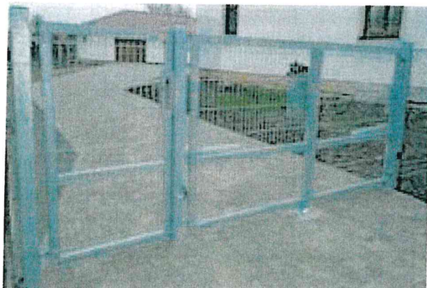
Ilustrační foto nové brány