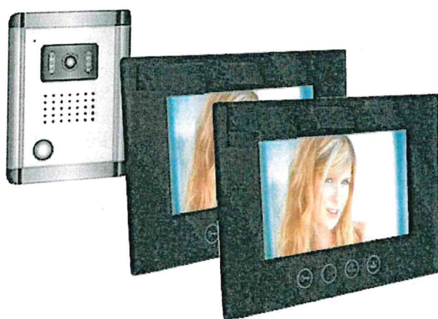
Ilustrační foto videotelefonu

Videotelefon s dotykovým ovládáním a s barevnou kamerou s nočním přísvitem v provedení antivandal, barevným monitorem LCD min. rozměr displeje 8 palců, s ovládáním el. pohonu dvoukřídlé brány a zámku vstupní branky (monitor umístěný na vrátnici), umístění kamery videotelefonu s mikrofonom na sloupu u vstupní branky;