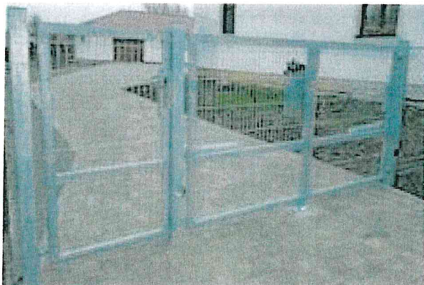
Ilustrační foto nové brány