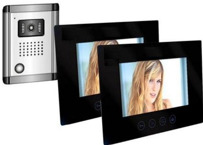
Ilustrační foto videotelefonu

Videotelefon s dotykovým ovládáním a s barevnou kamerou s nočním přísvitem v provedení antivandal, barevným monitorem LCD min. rozměr displeje 8 palců, s ovládáním el. pohonu dvoukřídlé brány a zámku vstupní branky (monitor umístěný na vrátnici), umístění kamery videotelefonu s mikrofonem na sloupu u vstupní branky;