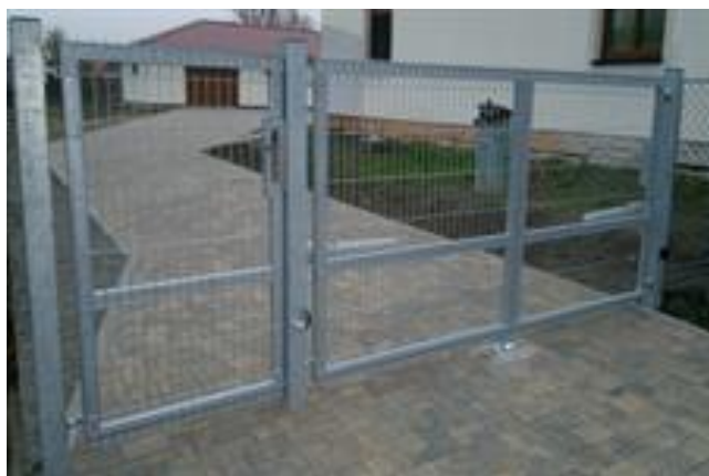
Ilustrační foto nové brány