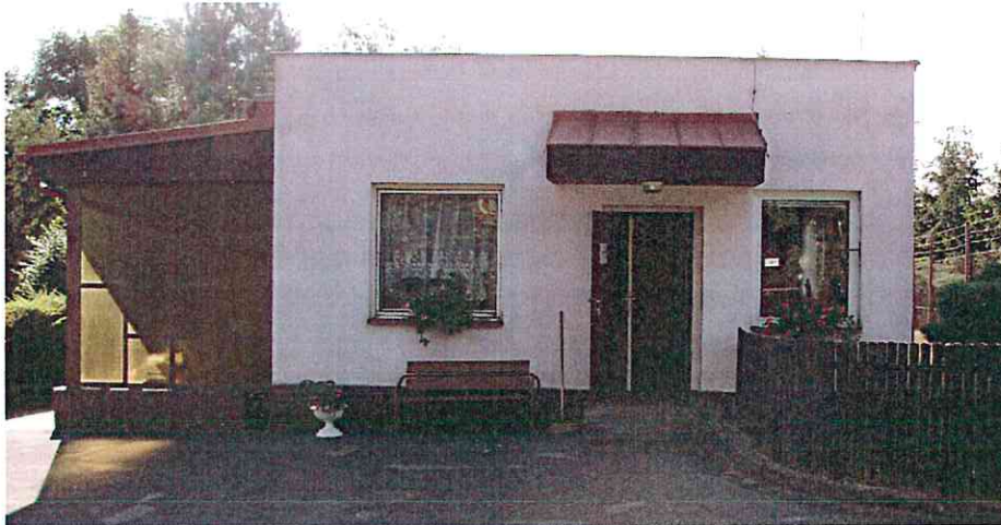
vrátnice – boční pohled